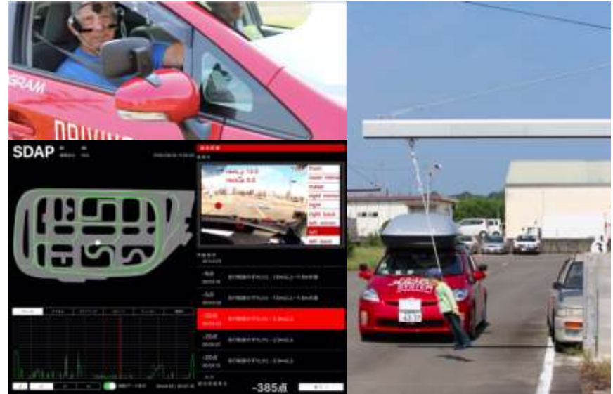
S.D.A.P. (AI型自動車運転評価システム)