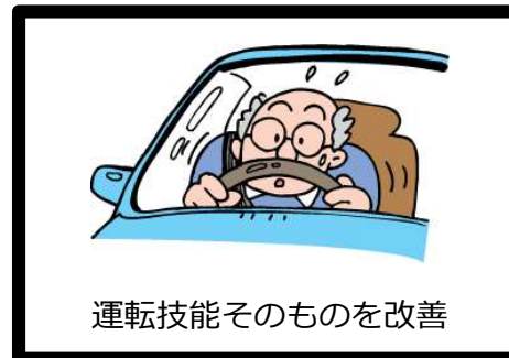
カーリハ（車の運転を使ったリハビリ）

教習所とデイサービスが連携することで、脳機能、身体機能、運転技能のリハビリを複合的に行う為のカーリハプログラムを創出。プログラムをより効果的に行う為に弊社開発のAI型自動車運転評価システムを活用し、サービス提供を行っている。