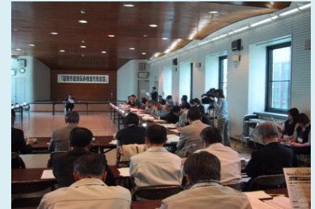
延岡市健康長寿推進市民会議