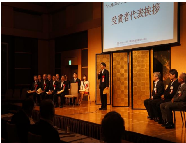
「受賞者代表コメント」